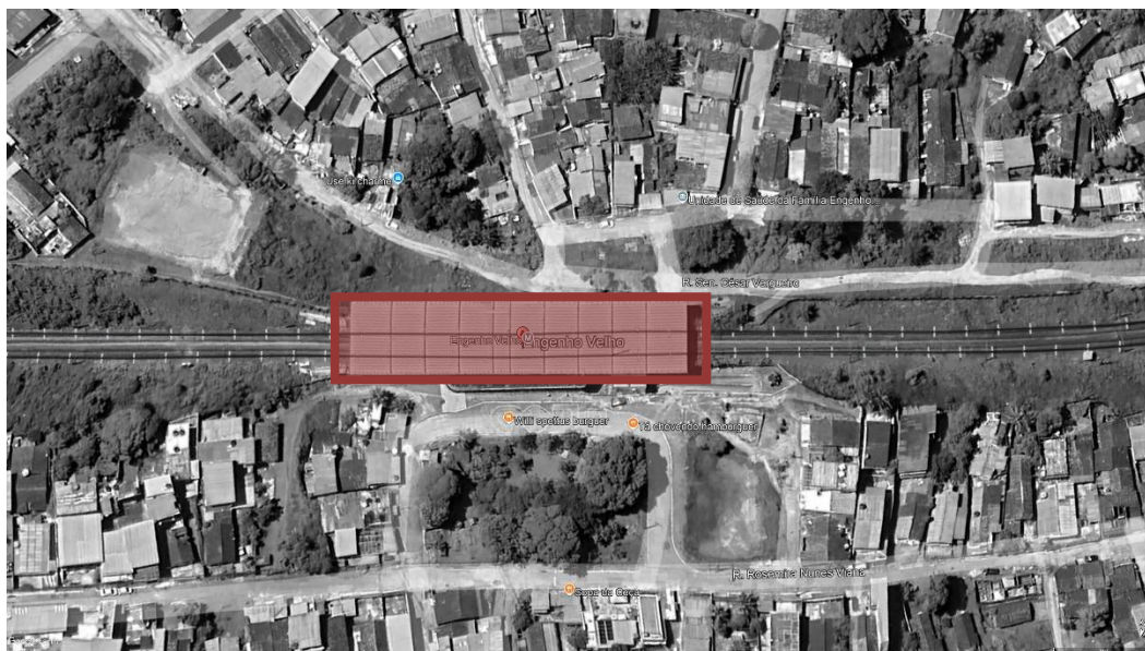
FIGURA 1 – ESTAÇÃO ENGENHO VELHO